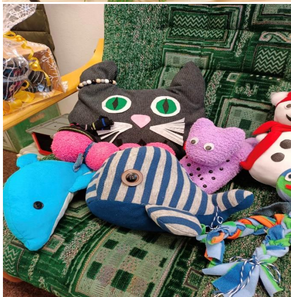
Vánoční zámek Libochovice