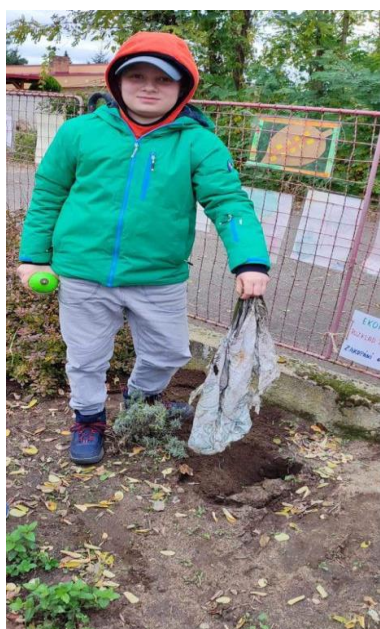
Ekotaška- stav duben