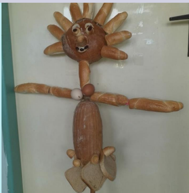
Vyrábíme z pečiva