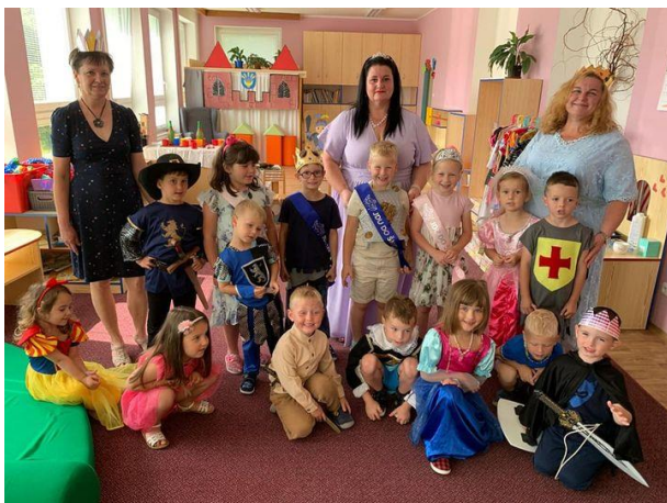
Besídka + rozloučení s předškoláky