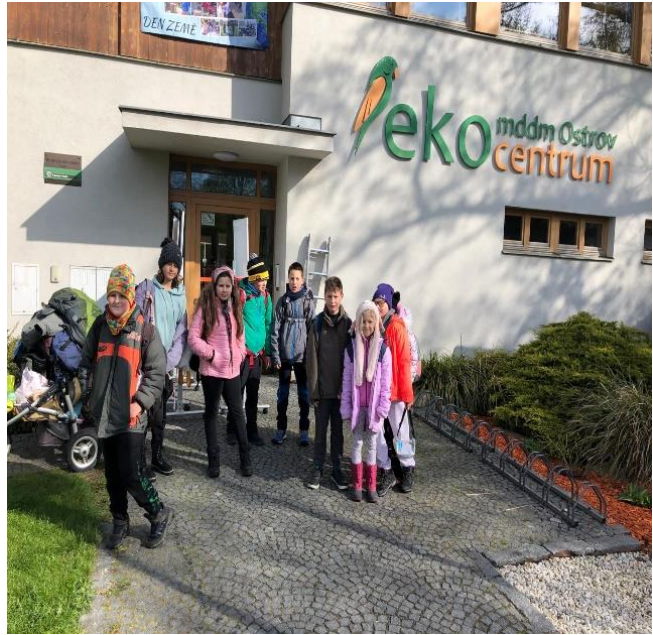
Duben 2024- návštěva Ekocentra v Ostrově nad Ohří