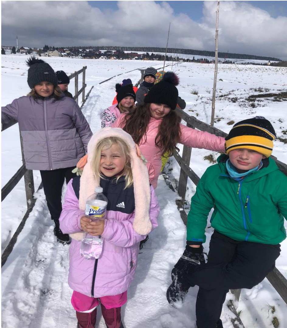
Duben 2024- Projekt Předcházení vzniku odpadů