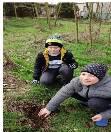
O sazenice se učíme řádně starat