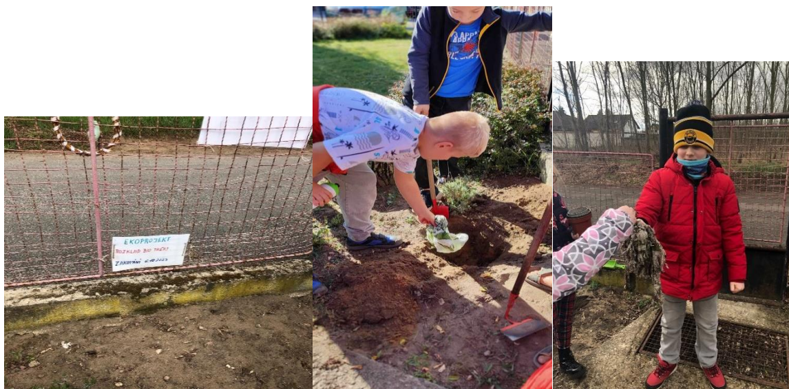
Ekotaška- stav únor 2024

Vlastní projekt v rámci Celoročního cíle - v říjnu 2024 zakopána tzv. biologicky rozložitelná plastová taška