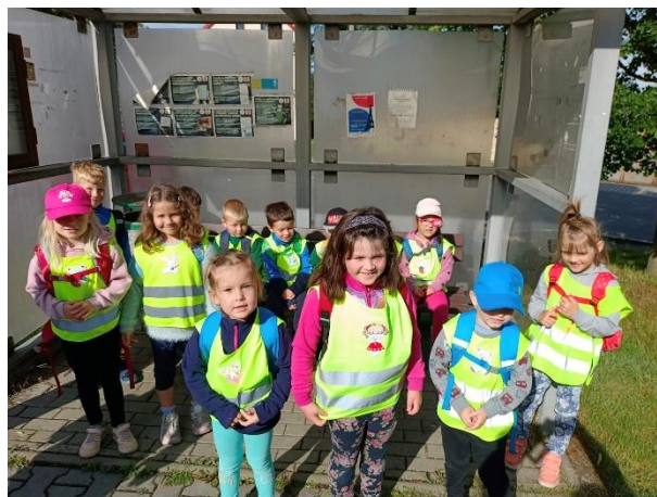
Výlet do Roudnice nad Labem