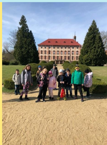
Velikonoce v Libochovicích