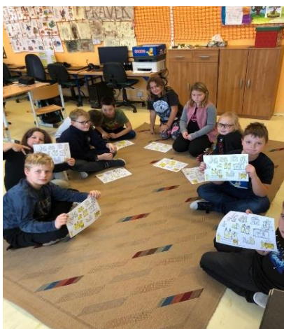
Praktická část Ekoabecedy - řazení kartiček, hra trimino.