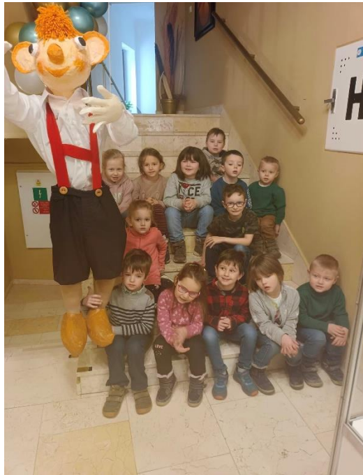
Loutkový festival Litoměřice