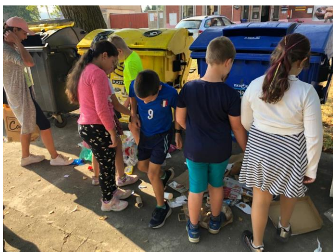
Září/ říjen 2023 Po stopách Plýtváka šatního