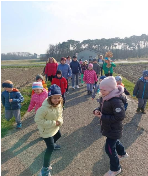
Vynášení Moreny do Labe